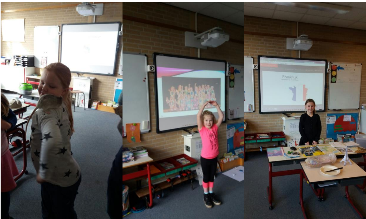
Spreekbeurten in groep 4