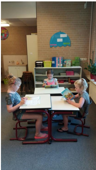
Wij starten met lezen