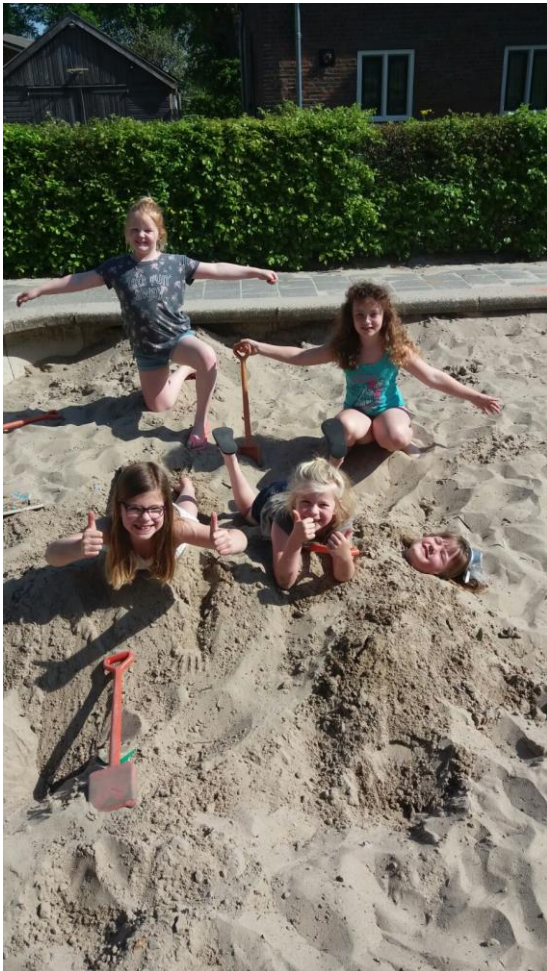
We spelen dat we op het strand zijn!