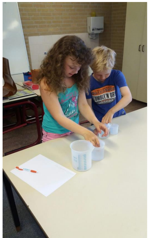
Meten is weten